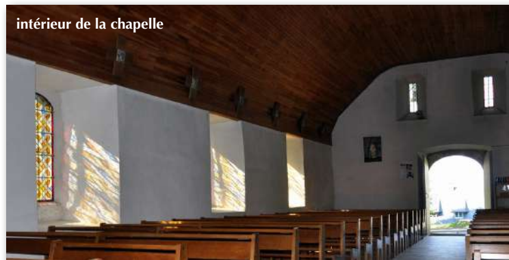
intérieur de la chapelle

« ...Et vous dire que je veux que, plus tard, on m'élève une chapelle au-dessus de ce lieu, à droite, sur la plaine, à l'endroit où vous trouverez une pierre marquée d'un signe. »