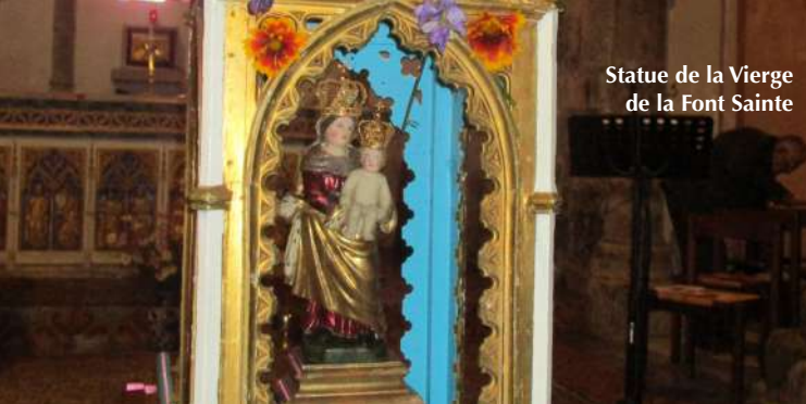
Statue de la Vierge de la Font Sainte