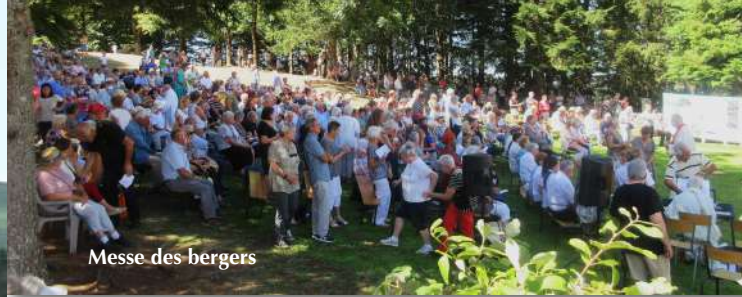
Messe des bergers

A partir du lundi 1er juillet jusqu'au dimanche 25 août