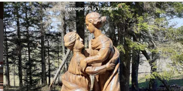
groupe de la Visitation