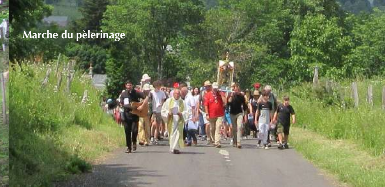
Marche du pèlerinage

La Vierge Marie tient une place importante dans la vie de l'Eglise, dans le coeur des chrétiens et de beaucoup de personnes. Notre Dame de la Font Sainte, érigée en Sanctuaire Diocésain depuis Juin 2020 est l'un des trois plus importants lieux de pèlerinage du Cantal, avec Notre Dame de Quézac (en Châtaigneraie) et Notre Dame de Lescure (en pays de Saint-Flour).