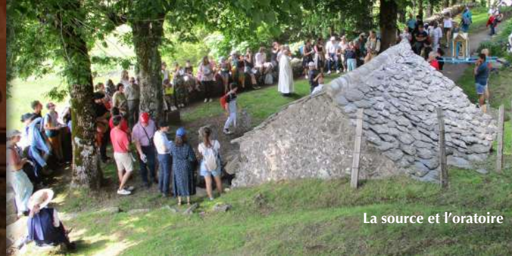
La source et l'oratoire